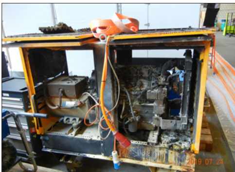
alter Stromerzeuger nach dem Brand